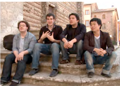
Idomeneo - Quartett