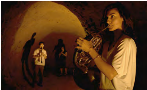
Musik in der Grotte