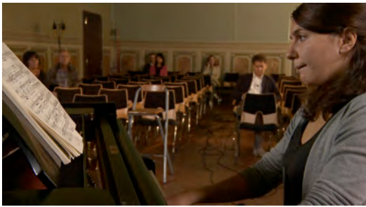
Meisterkurs Klavier mit Andrea Lucchesini