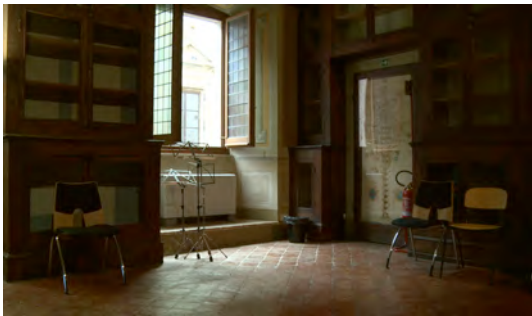
Stimmung im Palazzo Ricci