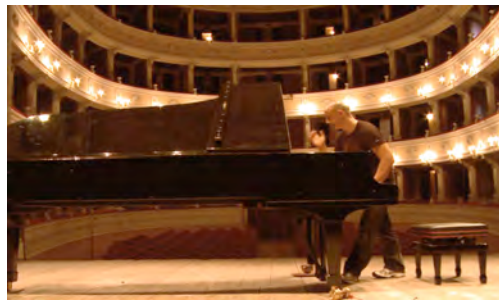
Klavieraufbau im Theater Poliziano