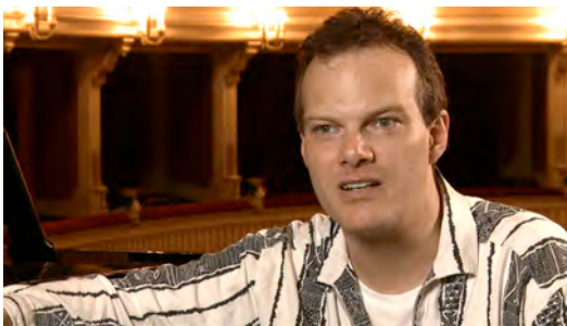
Interview mit Lars Vogt